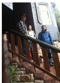
Trotz Regen wohlbehalten am Jagdhaus angekommen