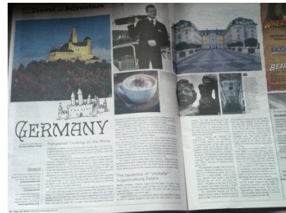
Der Artikel im Whistler-Magazin

Und im August dann endlich das langersehente Barbecue in Wertheim . Zum zweiten Mal stellte uns die Marinejugend Wertheim ihr Vereinsheim und das schöne Gelände direkt an der Tauber zur Verfügung. Auf dem Programm standen natürlich als erstes das Barbecue, daneben die Besichtigung des Klosters Bronnbach mit einer sehr exklusiven Führung sowie Kanu- oder Kajakfahren auf der Tauber und dem dem Main. Die Unterkunft diesmal war sehr individuell, kuschelig und absolut lohnenswert, fast ein bisschen abenteuerlich. Wir durften im Kloster schlafen, einige Glückliche sogar im bzw. am Vereinsheim.