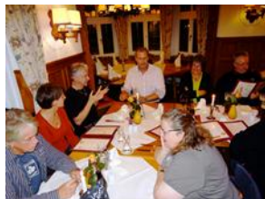
Viele sind bereits am Donnerstag angereist