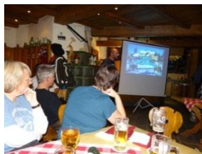
Der Vortrag am Freitagabend