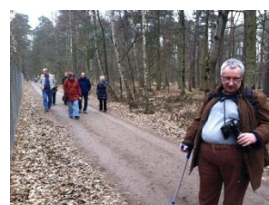
Weiter geht's am Wolfsgehege vorbei