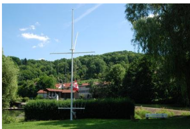
Die Fahne wird gehisst und die Nationalhymne ertönt

Und im August dann endlich das langersehente Barbecue in Wertheim . Zum zweiten Mal stellte uns die Marinejugend Wertheim ihr Vereinsheim und das schöne Gelände direkt an der Tauber zur Verfügung. Auf dem Programm standen natürlich als erstes das Barbecue, daneben die Besichtigung des Klosters Bronnbach mit einer sehr exklusiven Führung sowie Kanu- oder Kajakfahren auf der Tauber und dem dem Main. Die Unterkunft diesmal war sehr individuell, kuschelig und absolut lohnenswert, fast ein bisschen abenteuerlich. Wir durften im Kloster schlafen, einige Glückliche sogar im bzw. am Vereinsheim.