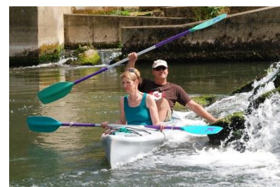
...mit guter Laune