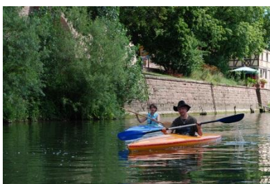
Eine hatte Schwierigkeiten mit dem „Lenken“ :-)