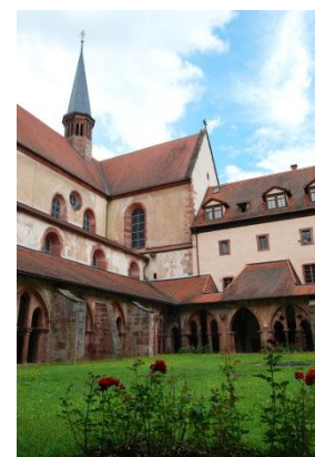
Das Kloster und das besagte Dach unter dem wir exklusiv wandeln durften