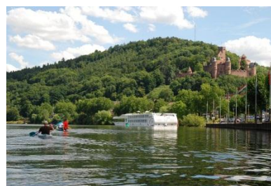
Die schöne Burg in Wertheim